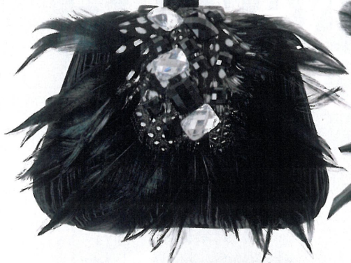
Torbica Azone , 39 €