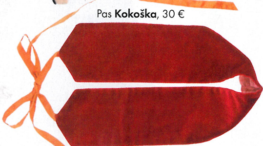
Pas Kokoška , 30 €