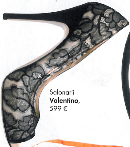
Salonariji Valentino , 599 €