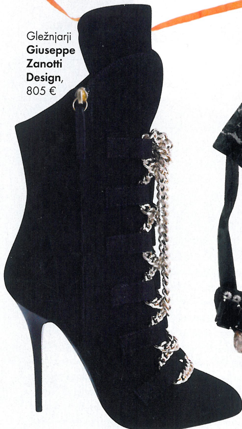
Gležnarji Giuseppe Zanotti Design , 805 €