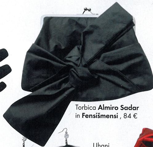
Torbica Almiro Sadar in Fensišmensi , 84 €