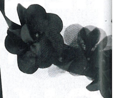
Ogrlica Lunca , 25,90 €