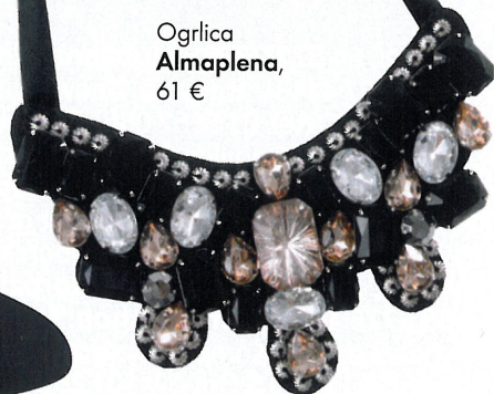
Ogrlica Almaplena , 61 €