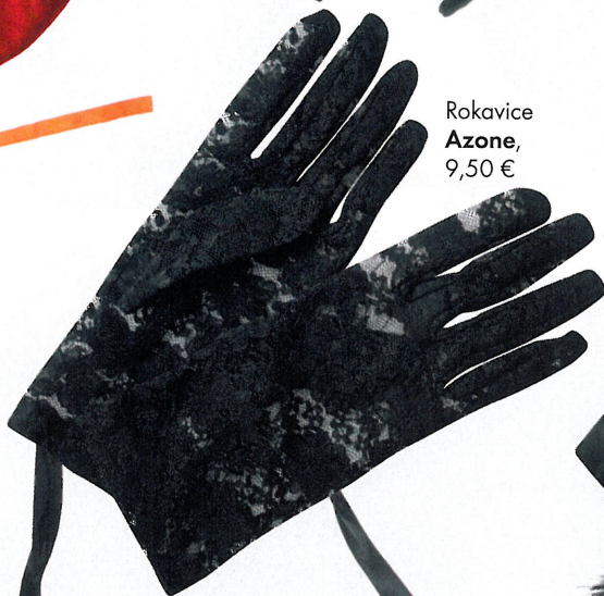
Rokavice Azone , 9,50 €