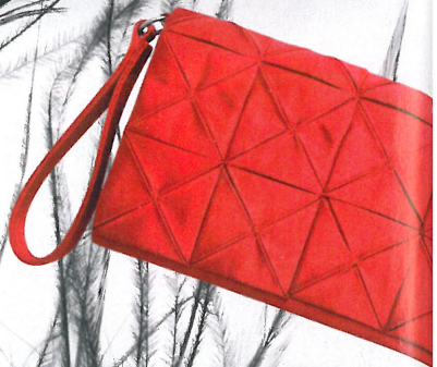
Torbica Francesca Biasia , 125 €